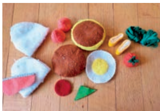
まい先生手作りのままごと具材