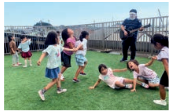
「高校生の時に体験したボランティアの活動が保育士への道の第一歩でした。」

同期にギターを弾いていた保育士がいて、「自分も！」とボーナスでギターを買って練習しました。簡単なコードから始めて、「子どもたちの前でやっこ」と勧められ、クリスマス会で子どもたちに喜んでもらったことが自信になりました。