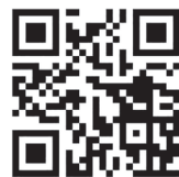
静岡市立こども園の紹介 ぜひ見てね！